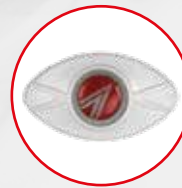
TF-RIP-R Melderparallel- anzeige