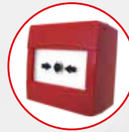
TF-CP Druckknopfmelder rot