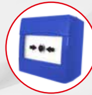
TF-CP-ES Druckknopfmelder blau