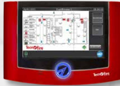
TF-T-7SC Bedienteil mit Lageplan- verwaltung